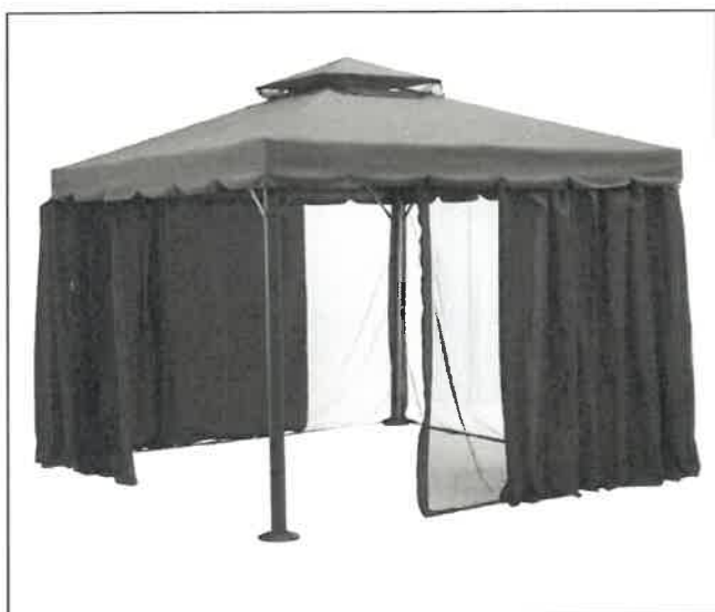
Havepavillon 3x3 meter (fastgøres på fliserne)