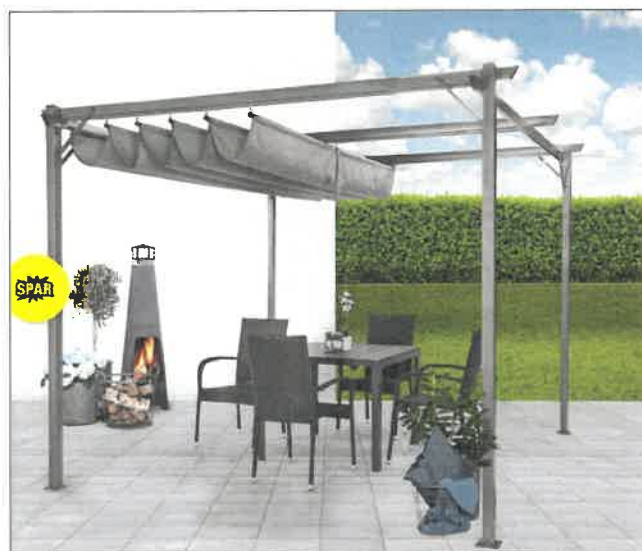
Pergola 3x3 meter (fastgøres på fliserne)