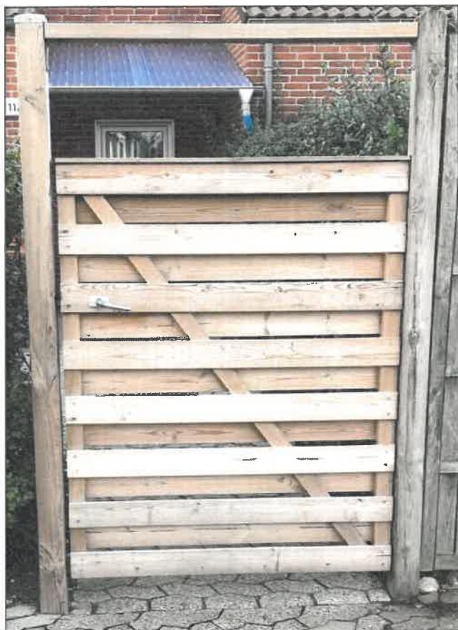
Havelåge, der er lavet i samme stil som hegnet i Majsvangen